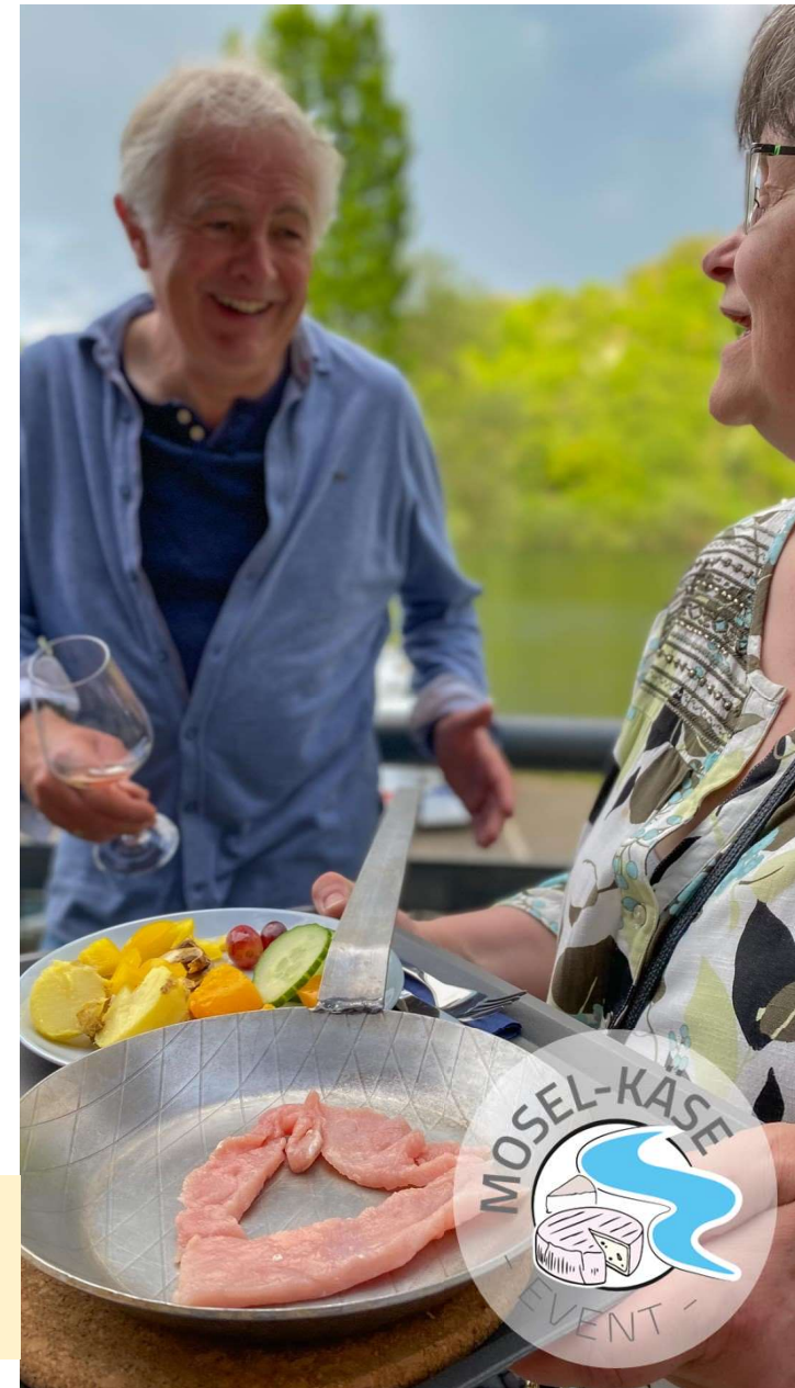
Viezgenuss beim Käse-Plausch am rustikalén Outdoor-Raclette-Tisch ...